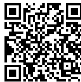
■视频:新快报记者 林里