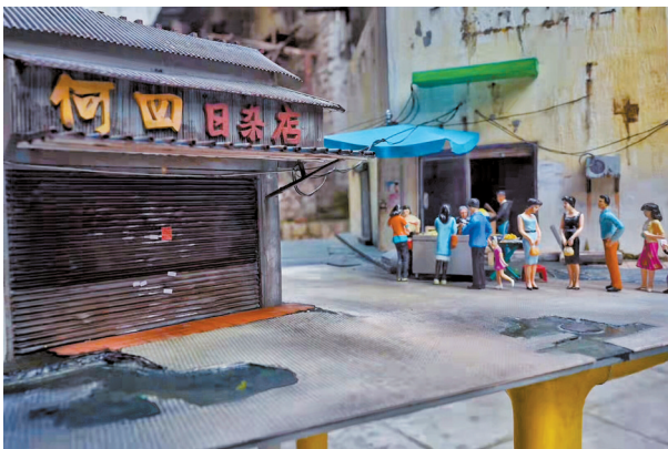
■牛杂档周围的环境,例如水坑、电线、空调漏水的痕迹、墙壁上的小广告也被一一复原。