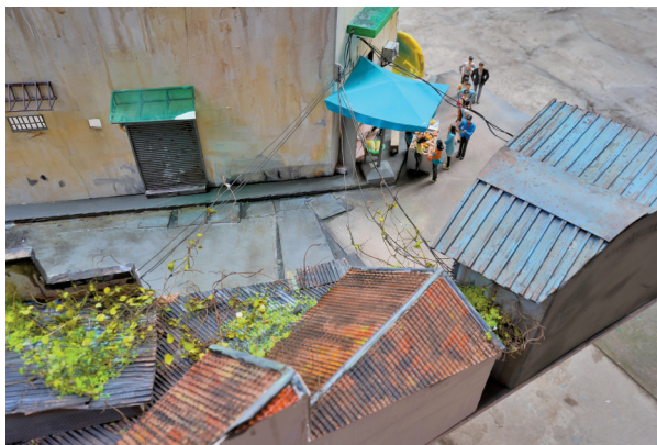
■作品《阿婆牛杂》以1:20的比例还原了当时的街景,一隅之间包含着老广州的独特风情,成为广州旧时光的“琥珀”。