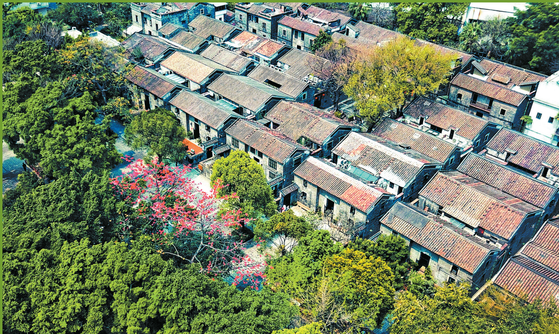
■麻石街、青砖楼、锅耳墙、趟栊门……聚龙村迄今有133年历史。

聚龙村建好后,住进去的都是邝氏家族的富贵人家,故而也被称为“邝家村”。而建造聚龙村的邝氏三兄弟,在一百多年前已经采用现代理念建房子,从招标到定价,再到认购和以抽签方式进行分配给族人居住,也因此被视为广州房地产开发商的“鼻祖”。