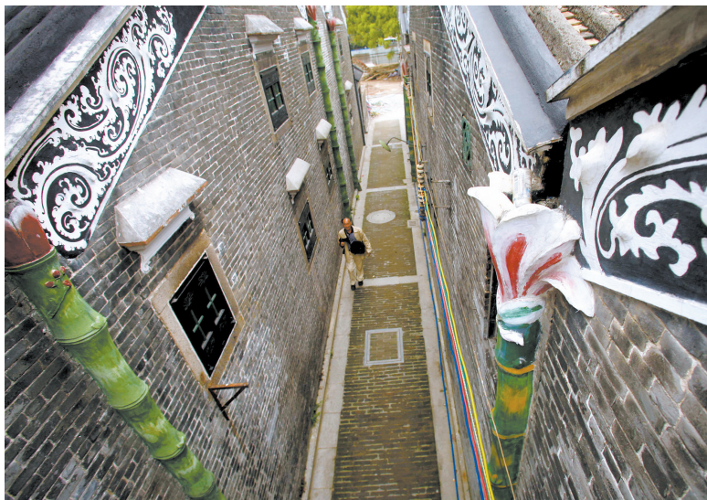
■作为广州城区内保存最为完整的古村落之一,透过趟栊门,还能看见屋子里的吊灯、木质桌椅台凳等。

沿冲口涌从陇西直街走到聚龙村,道旁绿树掩映,居民或闲适或匆促,一个典型的老广州生活气息浓郁的空间即视感。