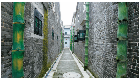
■据说聚龙村的规划是按“井”字形布局,七条街巷纵横铺排。