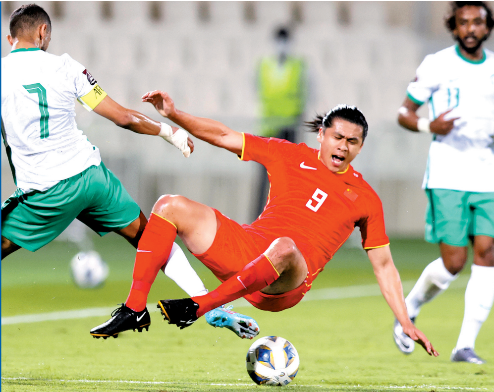
■张玉宁期待参加今年的亚运会。