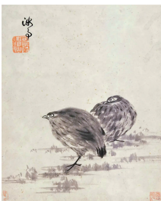
■清 朱耷《杂画册(局部)》

艺海藏珍——广州艺术博物院藏历代绘画精品展·花鸟篇,2022年4月26日-2022年7月25日,在广州艺术博物院一楼中国历代绘画馆举行。开展时间将根据疫情防控相关要求进行调整。