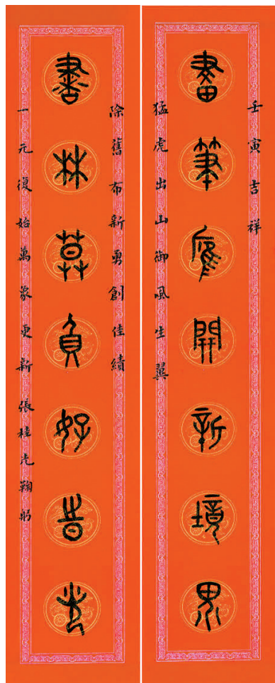
■张桂光《画笔书林联》