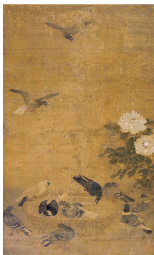
■元 佚名《金盆浴鸽图》