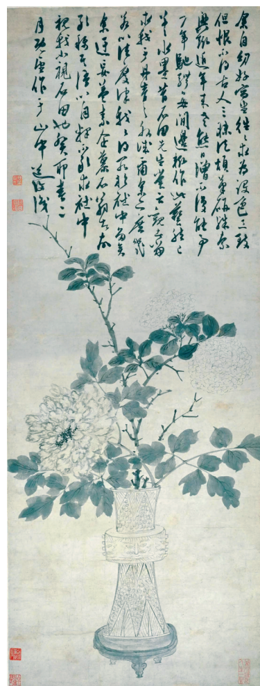
■明 陈淳《花觥牡丹图》