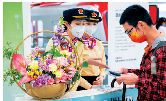
■市民在广州地铁7号线西延顺德段开通首日进行体验。