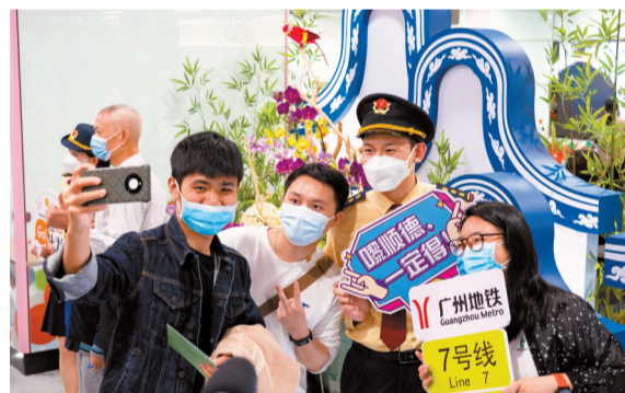
■广州地铁7号线西延顺德段开通首日,乘客打卡留念。

展望未来,佛山市将对标国内一流城市,紧抓全面加强基础设施建设重大机遇,积极构建层级合理、高效快捷、均衡一体的轨道交通网络体系,进一步深化广佛全域同城战略,全力加快推进轨道交通项目建设,持续提升佛山轨道交通网络化运营水平,进一步促进广佛互联互通,与广州市一起做大做强广佛极核,提升广佛极核在湾区乃至世界的影响力。