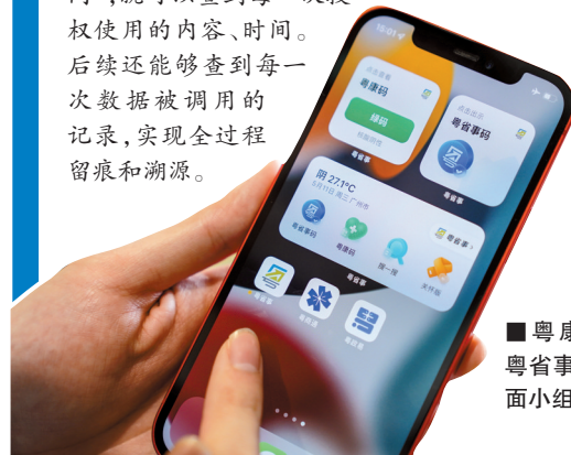
■粤康码、粤省事码桌面小组件。

“个人数字空间”作为今年广东数字政府重点建设任务,率先在粤省事App上线。空间首批包含92项常用证照和31项常用个人数据,为个人数据授权使用探索出一条更稳定、更方便的实施路径。过去,群众授权政府部门或企业使用数据,往往采用签书面协议、提供纸质材料等传统方式。现在,“个人数字空间”能够更方便实现“个人授权、全程溯源”。登录后,用户通过出示粤省事码等形式,授权对方使用自己的特定数据。在此过程中,数据使用方、使用事由等信息,将通过省政数局的“数据资产凭证”生成不可篡改的记录。用户打开“个人数字空间”,就可以查到每一次授权使用的内容、时间。后续还能够查到每一次数据被调用的记录,实现全过程留痕和溯源。