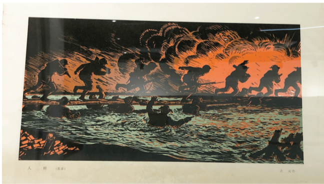
■古元版画《人桥》(旧版印刷品)在“为时而著——习之堂藏延安文艺讲话文献展”上展出