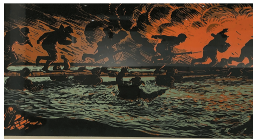
■古元 版画《人桥》(旧版印刷品)在“为时而著——习之堂藏延安文艺讲话文献展”上展出。

论在全国是比较活跃的,这与广东作为改革开放前沿、毗邻港澳地缘都有关系,因为文艺本来就跟时代有密切关联。无论将文艺视为“文学与艺术”,还是将文艺理解成一种“社会意识形态”,广东的相关研究都有一些重量级的学者,在全国有很大影响。这些学者分布在高校及科研院所的哲学、中文、历史等诸多学科,并不限于哲学系。