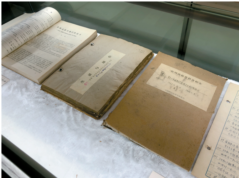
■“为时而著——习之堂藏延安文艺讲话文献展”展出的藏品。