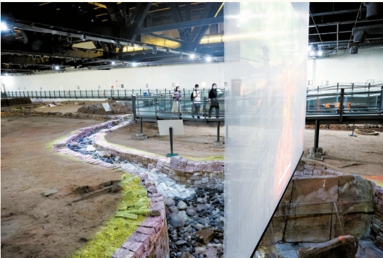
■ 南越国宫苑曲流石渠复原展示。