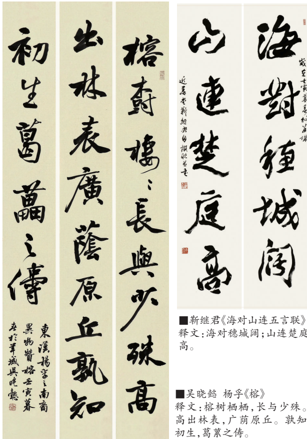
■靳继君《海对山连五言联》 释文：海对穗城阔；山连楚庭高。