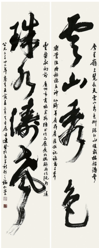
■连登《云山秀色;珠水涛声》,对联旁一首调寄阮郎归《云山珠水》:摩星岭上览长天,云山秀色妍。珠江水暖载楼船,涛声乐管弦。持稻穗,五神仙,骑羊肩并肩。蒞城祝福万千年,丰盈永向前。题云山珠水,调寄阮郎归。

“持稻穗,五神仙,骑羊肩并肩。蒞城祝福万千年,丰盈永向前……”日前,在横渠书院美术馆展厅前一位市民边读边笑语“有意思,有意思”。一幅书法作品,除了笔墨功夫到家,布局气格非凡外,内容内涵也是打动人的关键要素。这幅《云山秀色 珠水涛声》作品,正出自广东省书法家协会顾问、广州市书法家协会名誉主席连登之手,他在创作这幅三米多高巨作之时,除了考虑书法艺术创作之外,还新作了一首词,可谓“图文并茂”歌颂了千年广州,而接受收藏周刊记者专访时,他认为,书法创新取决于知识积累。