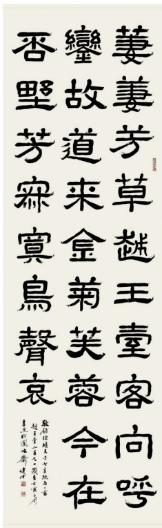
■秦建中《徐续《夫子》》,释文:萋萋芳草越王台,客向呼壑故道来。金菊芙蓉今在否,野芳寂寞鸟声哀。