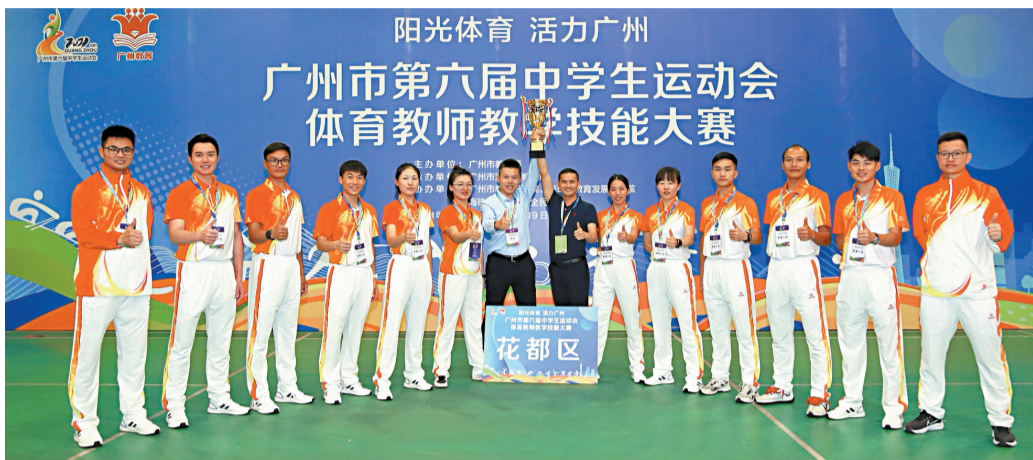
■花都区体育教师代表队参加广州市第六届中学生运动会体育教师教学技能大赛,荣获团体总分一等奖。