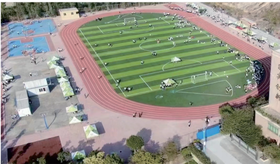
超大体育场,尽情挥洒青春