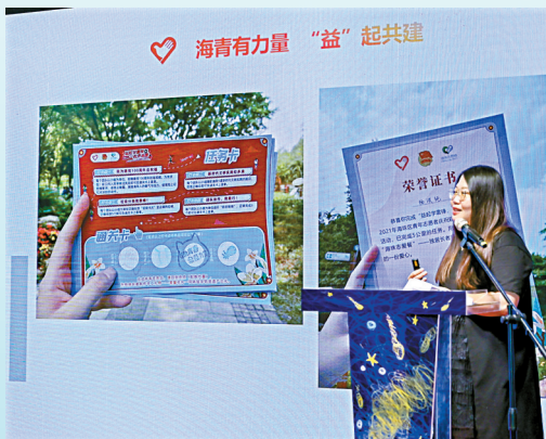
■中国银行广州海珠支行团委书记分享心得,称要让公益成为日常生活的一部分。