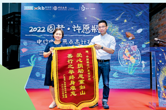
■鸿基和妈妈无法出席活动,将精心制作的锦旗快递到现场送给志愿者。