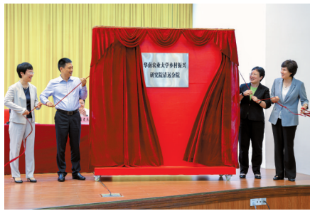
■华南农业大学乡村振兴研究院清远分院揭牌。

殷昭举强调,要坚决守住粮食安全底线,全面落实粮食安全党政同责,着力抓好安全储粮和安全生产工作,狠抓高标准农田建设和撂荒耕地复耕复种两项“粮安工程”,切实保障粮食安全。