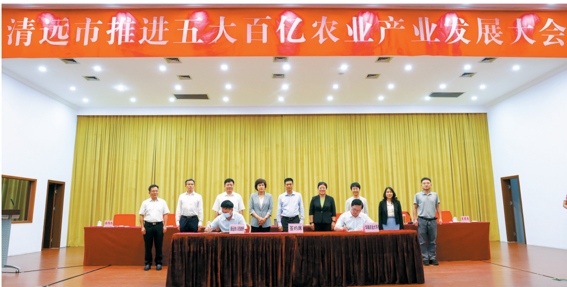
■会议现场,清远市人民政府与华南农业大学签订实施乡村振兴战略战略合作框架协议。

■采写:新快报记者 潘芝珍 通讯员 樊乾 李思靖 清农讯