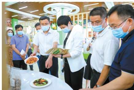
■参观连州菜心省级现代农业产业园核心区。