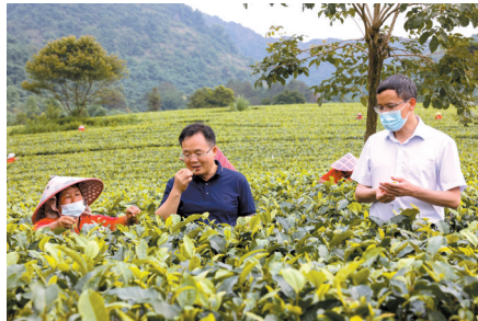
■英德市横石塘镇积庆里红茶谷,漫山遍野都是翠绿的茶树。