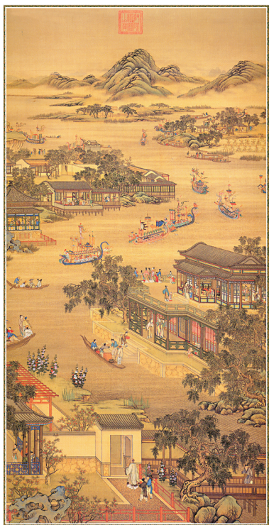
■清 清院本十二月令图册之五月 龙舟竞渡

龙舟题材在明代画家中并不多见,目前能品赏的则有画家郑重的《龙舟竞渡图》轴,画面款署:“千里郑重”;钐有清内府收藏印:“三希堂精鉴玺”“宜子