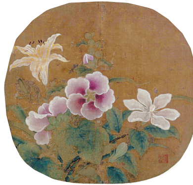
■无款《夏卉骈芳图》北京故宫博物院藏