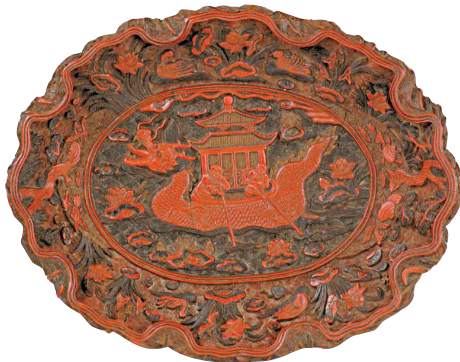
■剔彩龙舟图荷叶式盘