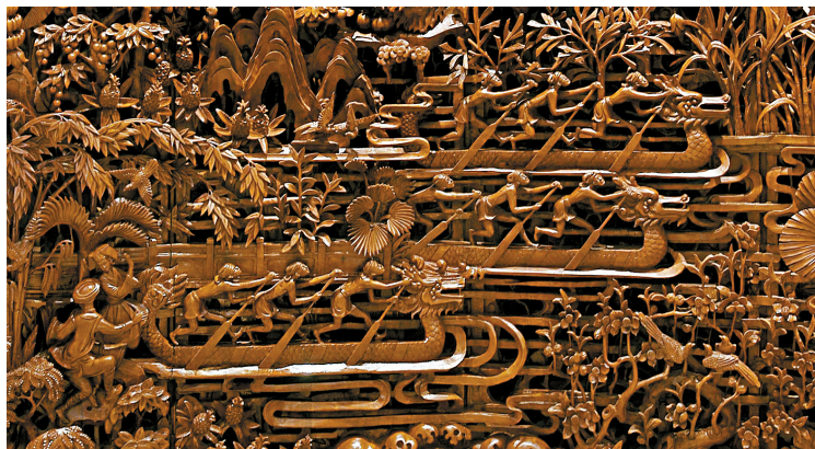
■齐喆《南粤秋实》(局部)

民间的习俗活动,第一张表现的是潮州饶平端午节时赛龙舟前“抢龙卵”的仪式,第二张表现的是流行于珠海、澳门、中山一带的民间舞蹈“醉龙舞”。两张画表达的是对过去美好事物的庆祝,对当下生活的满足和对未来生活的期许。