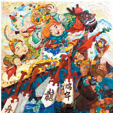
■陈钊《民间喜乐》表达端午节时赛龙舟前“抢龙卵”的仪式

英国学者孔佩特所著的《广州十三行——中国外销画中的外商(1700—1900)》也写到当时十三行销售漆器的情况:“描绘广州的图像——在一字排开的西式商馆形成之前——也出现在不同的外销西方工艺品上,有漆绘屏风、漆桌、象牙板和瓷器。”他在另一个地方也写道:“描绘广州商铺的外销画往往会将商品的细节描述得非常精细。图中的红色漆器商店的细节就十分详尽,尽管这无疑是由于表现画面的目的,但也可能是画家希望相对清晰地表现待售的商品。”