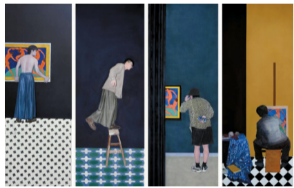
■黄长西《一路匆匆》系列