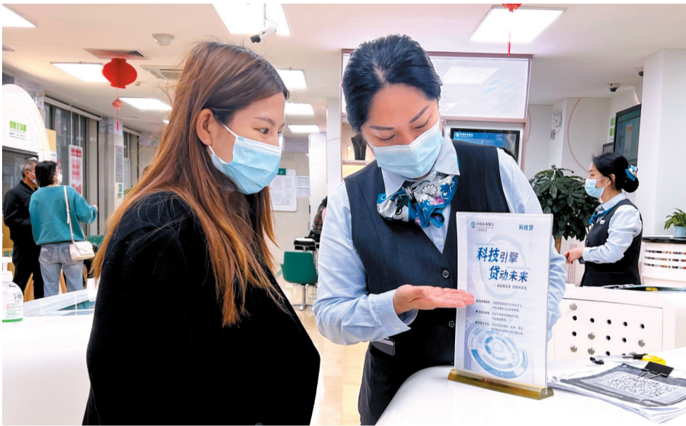
■农行广州分行客户经理耐心向客户介绍“科技贷”产品的额度和利率。

为缓解疫情影响,政策正持续加码,为小微企业纾困解难。今年4月,银保监会下发《关于2022年进一步强化金融支持小微企业发展工作的通知》(以下简称《通知》)指出,2022年工作的总体要求是坚持稳中求进总基调、持续改进小微企业金融供给。作为有责任担当的国有银行,农行广州分行始终围绕“六稳”“六保”战略任务,坚定不移地发挥普惠金融主力军作用,充分聚焦企业融资需求,提升产品质量和效率,切实助力普惠经济发展。截至2022年6月中旬,该行小微贷款余额近170亿元,比年初增37亿元,增速达28.5%,惠及8000户小微企业。