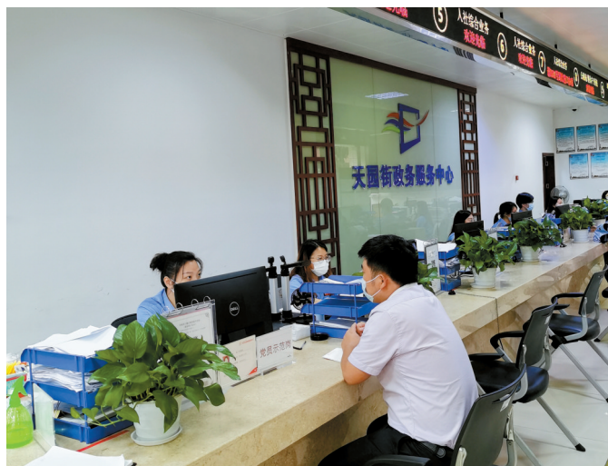
■在天园街政务服务中心,来穗人员向工作人员咨询。

对于合法稳定就业指标,有人认为,一些企业没有为职工缴存住房公积金,公积金不应该纳入积分指标。对此,市来穗部门曾提醒,单位不办理住房公积金缴存登记或者不为本单位职工办理住房公积金账户设立手续的,由住房公积金管理中心责令限期办理;逾期不办理的,处1万元以上5万元以下的罚款。如申请人所在用人单位未缴纳,可向广州住房公积金管理中心投诉依法追缴。