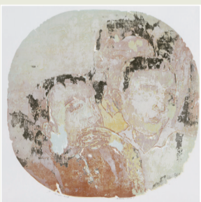
■周洁纯《如如·初晤》 45×45cm,套色木刻,2017