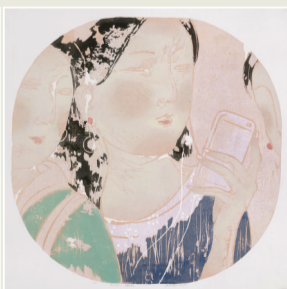
■周洁纯《如如·镜影》 45×45cm,套色木刻,2017