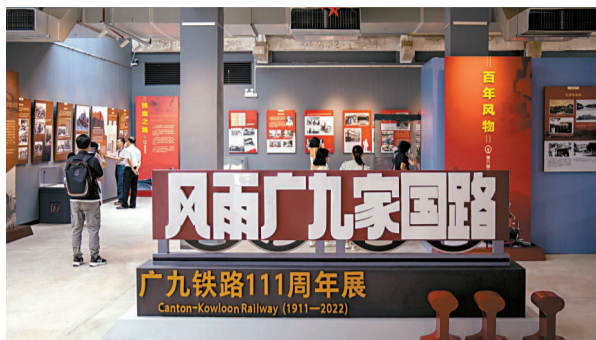
■展览现场。

广东省流动博物馆是广东省文化和旅游厅实施文化惠民、实现公共文化均等化的服务抓手,通过与省内基层博物馆的交流合作,实现流动博物馆分级、多节点的运作,实现更大范围内的文化惠民。同时,广东省流动博物馆正尝试打破省域边界:与毗邻的香港、澳门等地文博单位合作交流,打造“粤港