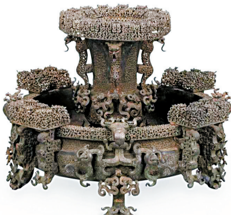
曾侯乙尊盘 1978年出土于湖北省随州市曾侯乙墓 现藏湖北省博物馆

曹操喝酒那是出了名的,他在诗中吟咏:“对酒当歌,人生几何?”自己藏这么多冰块,想必没少用来冰酒。