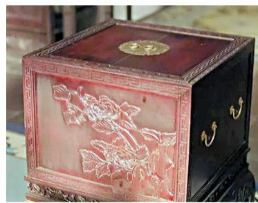
电视剧《延禧攻略》中的冰鉴

除此之外,剧中还展现了冰鉴的另一个功能,即在其中留下小孔,让冰水流到外面,人往那旁边一躺,这“冰箱”秒变“空调”。