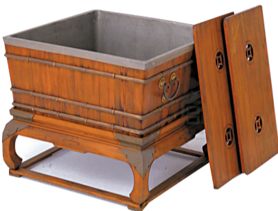
清 柏木冰箱 现藏故宫博物院