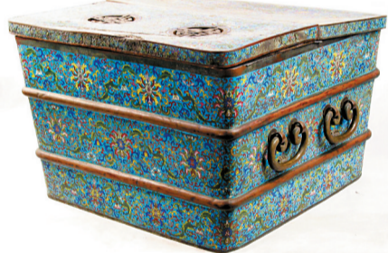
乾隆款掐丝珐琅宝相花大冰箱 现藏沈阳故宫博物院