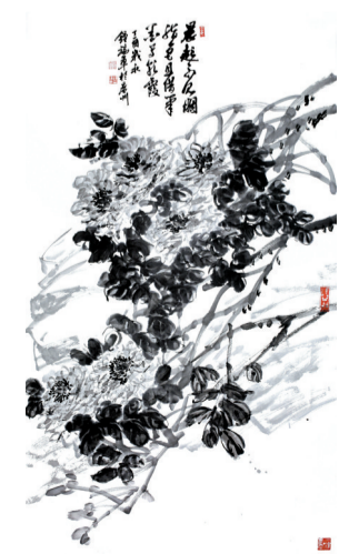
■钟瑞军《且借笔墨写朝霞》