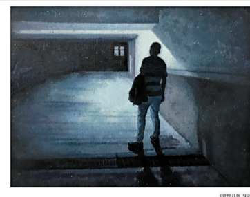
■《曾经几何 NO2》 油画 40x30cm