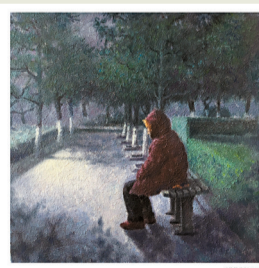
■《曾经几何 NO3》 油画 30x30cm

这系列作品《曾经·几何》是我对于人生的一个思考。“人生寄一世,奄忽若飘尘”,人的一生看似很长,实则犹如尘土,刹那间便被那疾风吹散,存在似有若无,快乐过也孤独过,满足过也失落过,跌跌宕宕平平淡淡。作品以最直接的布面油画为媒介,直抒胸臆,表现我眼中一些平常而感触的瞬间,也希望以绘画的形式体现我对生活的思量。三幅作品分别是童年时期、中年时期和老年时期的一个生活写照。当然生活需要思量,更需要行动。