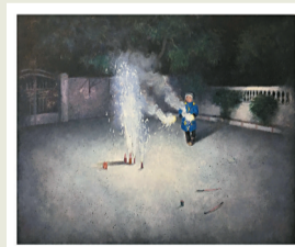
■《曾经几何 NO1》 油画 60x50cm