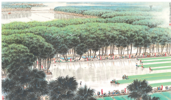
《春闹葵乡》陈章绩 1974年 广东美术馆藏