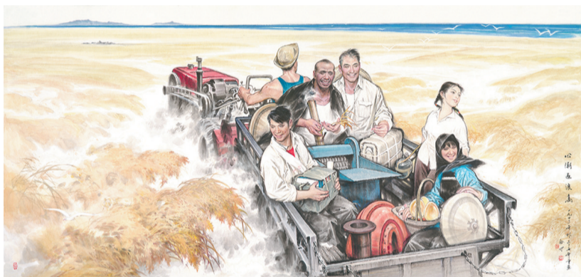
《心潮逐浪高》伍启中 1972年 广东美术馆藏

而女性画家潘梦露分享《筑梦家园》这幅画时则说,“这是我为纪念深圳特区成立30周年创作的,当时的深圳正处于一个飞速发展的时期,所以,在我上学的路上,我总会发现,路上常常出现一些新的建筑工地,我发现建设现场里面的女性身影非常有特色,于是,我便以女性的视角,用女性形象的艺术处理来切入,描绘深圳建设者工作的场景。”