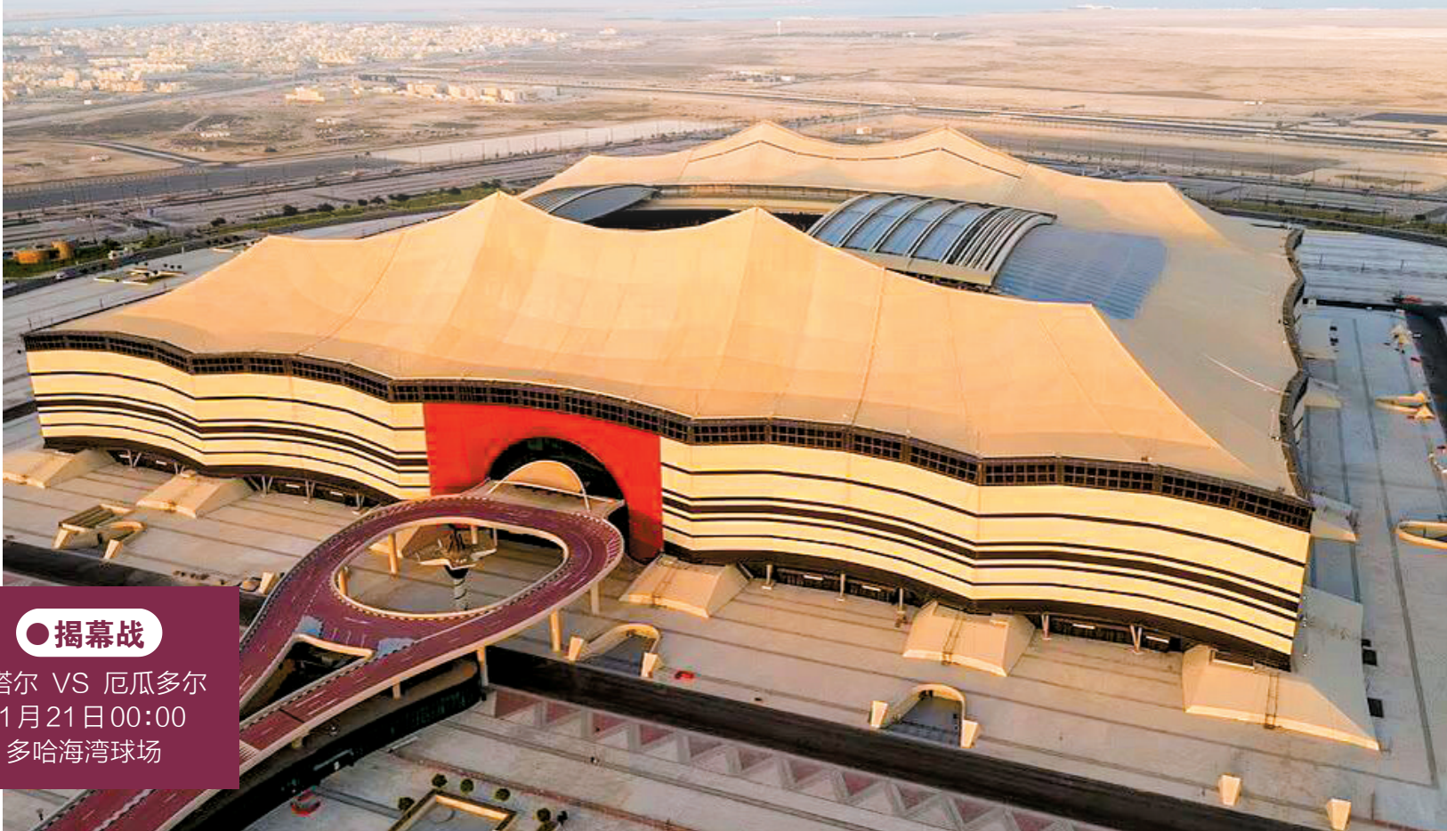
■海湾球场将承办揭幕战,外观就像一个阿拉伯式大帐篷。