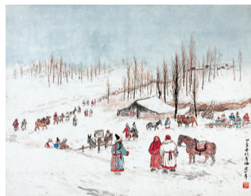
■关山月《青海塔尔寺庙会之一》