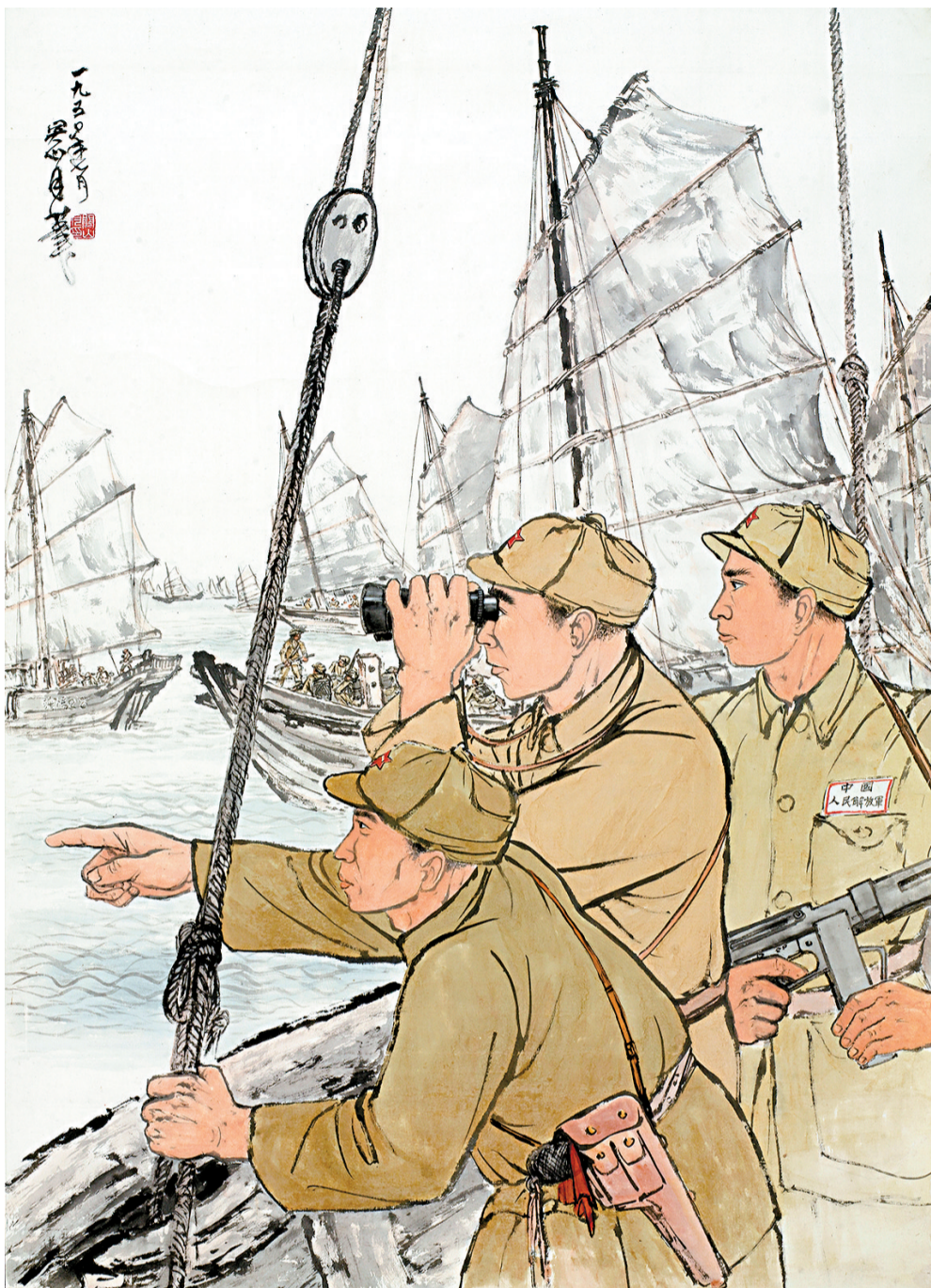
■关山月《进攻海南岛》1950年