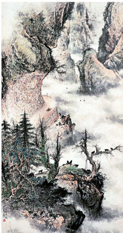
■关山月《新开发的公路》