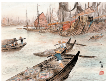
■关山月《闸坡渔港之一》