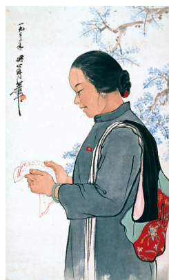
■关山月《一封家书》 1953年