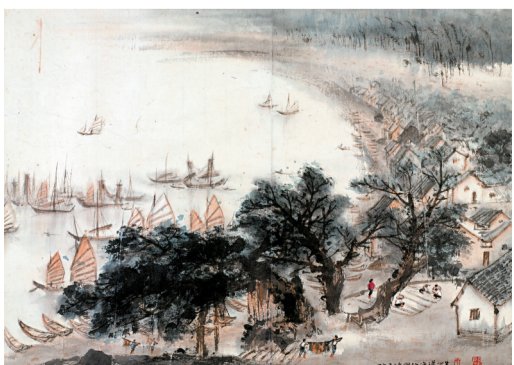
■关山月作品《闸坡渔港》。

有了第一笔资金,接下来的是如何设计的问题,谁能担纲设计?关山月与著名建筑设计师莫伯治交情甚笃。1989年,关山月带着梁世雄一起前往莫伯治工作室洽谈此事。让梁世雄想不到的是,莫伯治当即就答应了,而且十分重视,这在后来每次召开建馆研究方案会议,莫伯治到场必到可以说明这一点。用莫伯治的话来说则是:“关山月和黎雄才两位大师,嘱我替岭南画派设计一座纪念馆。”