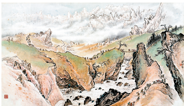
■关山月作品《长征路上》,现藏于关山月美术馆。

据梁世雄回忆,关老先让部分人去看情况,但那些人回来后反映,没什么内容可画。但关老并不认为这样,他便让梁世雄再去一次。结果,梁世雄到现场被那浩浩荡荡的堵海工程所震撼了,迅速回广州与关老商量,最后,关老决定让国画系学生都到那边写生。“当时全系师生一起参与,胡一川、关山月、黎雄才,包括当时中央美院教授罗工柳都一起到了当地(湛江堵海工程)。当时筑堤虽然没有多少大型机械,多为人力,但热火朝天的那种场景,气氛很好,很有感染力。”著名的巨作《向海洋宣战》正是那一次创作完成的。