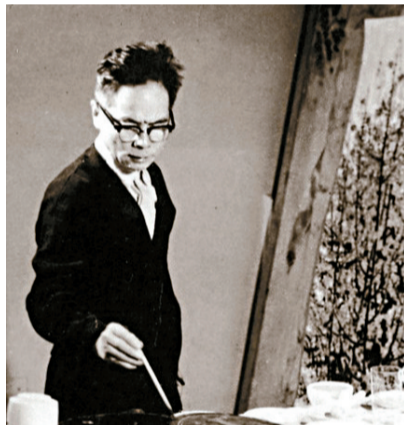
■上世纪70年代,关山月作画。

据梁世雄回忆:在上世纪八十年代,有香港“塑料大王”之称的实业家梁知行得知广州美院为筹款建设岭南画派纪念馆而举办展览时,他答应捐出一百万元。