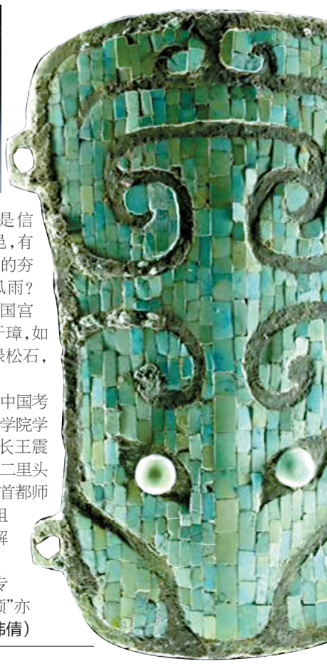
■二里头遗址铜牌饰

8月14日17时30分,此专题将在CCTV4重播,在“央视频”亦能回看。(潘玮倩)