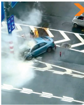
■外卖员和保安员加入救援队伍。