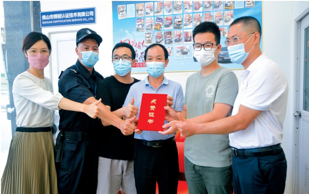
■佛山市顺德区文明办一行慰问见义勇为的街坊代表(中间4人)。