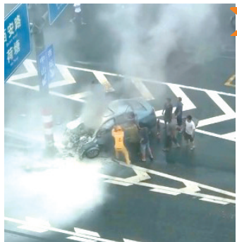
■众人用铁棍撬车门。