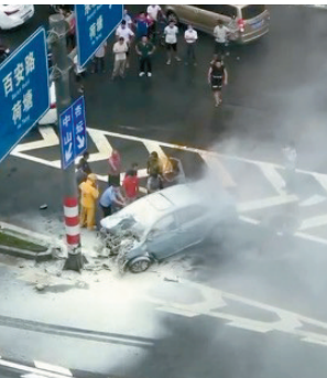
■一名警察参与救援。