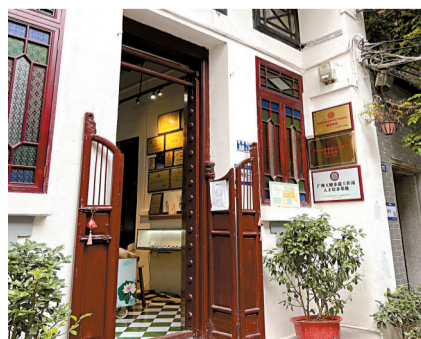
■耀华南22号的广州玉雕非遗技艺体验馆,可关注“广州非遗”公众号获取课程信息。

明清时期的广州城,经贸繁荣,清朝初年废除“匠籍”管理制度后,各地匠人汇聚广州,进一步催生了广州玉雕业的蓬勃发展,玉器商人们纷纷涌向岭南文化底蕴最为丰厚的荔湾西关一带捕捉商机。