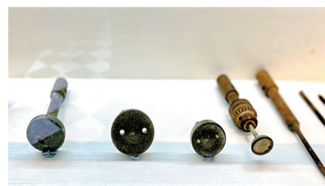
■非遗体验馆一楼陈设的各种琢玉工具,看上去有点“可爱”。

材”。属半透明玉的南方玉最有代表性,这种石料自然形成的斑纹多,经雕琢打磨后晶莹剔透,属玉石石料中比较特别的一种。