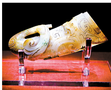
■西汉南越王墓馆藏玉器。

广州玉雕在选材上颇具广度,粤西信宜的南方玉使用较多外,翡翠、白玉、碧玉、青玉、岫玉等20多种软硬度不同的石料都是广州玉雕的“可塑之