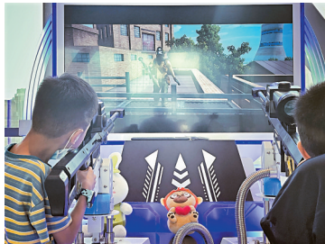
■越来越多的显示增强、虚拟现实游戏场景进入寻常百姓家。

天河区元宇宙联合投资基金正式发布,首批参与的8家投资机构在管基金总规模逾200亿元。上文提到的《广州市天河区数字政府改革建设“十四五”规划》打造天河区教育元宇宙也是其中一个体现,天河区将构建智慧教育服务体系,推进基于大数据的课堂教学行为诊断与改进,构建学生画像,创新教学、评价、管理等全过程教育数字化转型。探索打造集虚拟教育空间、教育课堂等于一体的天河区教育元宇宙,推进沉浸式教学体验,实现教学高效化、学习个性化。