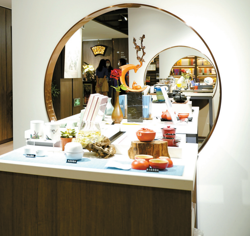
■南国书香节,给了市民丰盛的文化大餐。

不论阅读方式有何改变,阅读本身会是永恒地存在。2022南国书香节举办期间,新快报邀请了六位文化名家将他们的“心水”之书推荐给读者朋友们,并分享自己的阅读故事。希冀读者从文化名家的分享中,获取阅读的方向,感受阅读的美好。