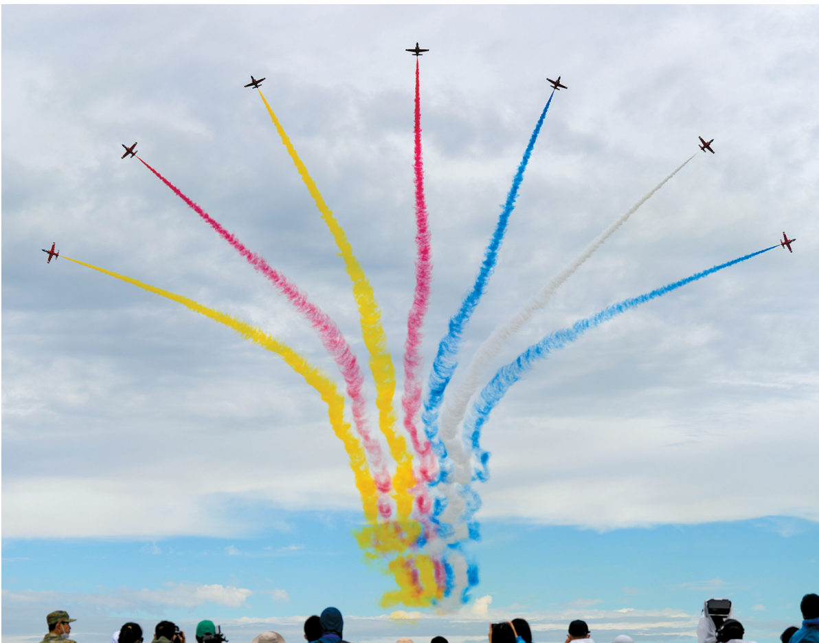
■8月26日,在空军航空开放活动暨长春航空展上,空军航空大学“红鹰”飞行表演队进行飞行表演。