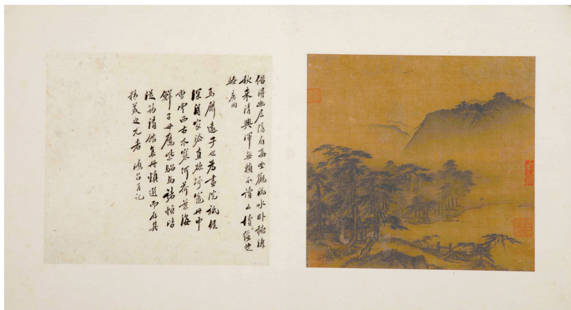
■南宋 马麟 松林亭子图轴