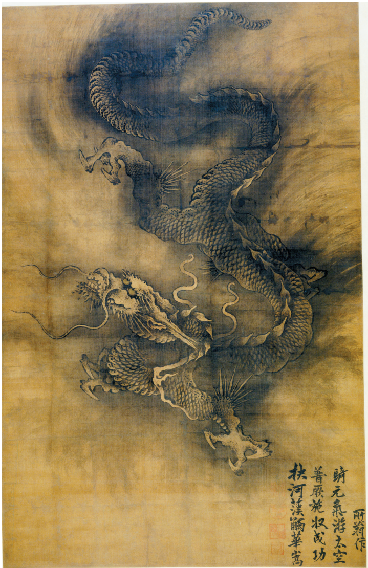
■南宋 陈容墨龙图 粤博藏