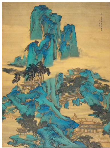
■(清)袁耀《仿阿房宫山水图》