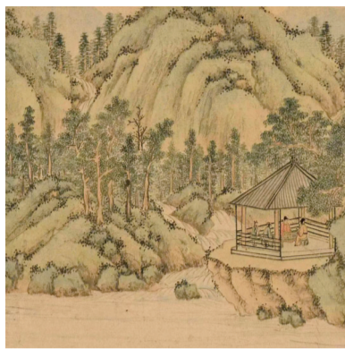
■(明)文徵明《醉翁亭书画合卷》(局部)