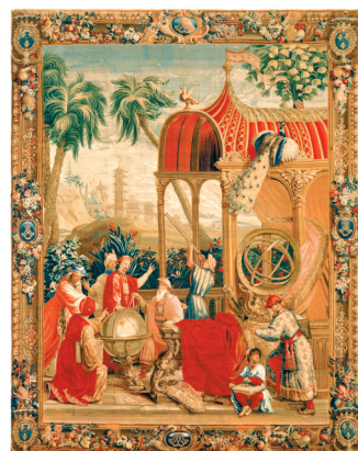
■《天学传概》,中国皇帝,主题挂毯,博韦工厂,17世纪末到18世纪初,美国洛杉矶,保罗·盖蒂博物馆

中国风经常运用于装饰性的镶嵌画、挂毯、墙纸,这些物品与绘画仍然有密切的关系,因为前者经常是由画家打稿,再将图案印上去。