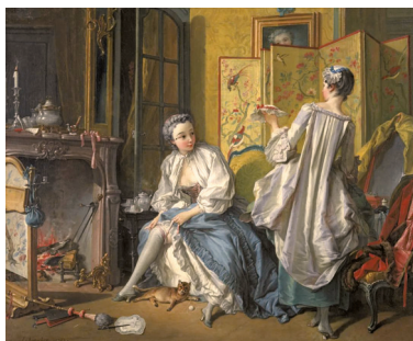
■弗朗索瓦·布歇《梳妆》,1742年,蒂森-博内米萨国家博物馆,马德里

布歇的画中,人物形象与景物充满想象的东方特质,但人物的姿态和画面的构图仍是西方的。