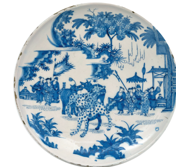
■代尔夫特仿青花瓷陶盘,17世纪晚期

当商人从东方运回大量瓷器后,欧洲便疯狂喜欢上瓷器,然而进口瓷器成本太高,于是欧洲各国开始研究如何制作瓷器,并大量生产带有中国风的瓷器。