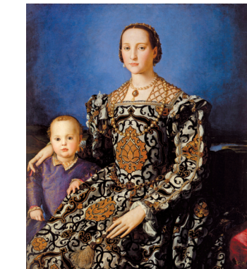
■阿尼奥洛·布龙齐诺,《埃莱奥诺拉·托莱多肖像》,木板油画,1545年,佛罗伦萨乌菲齐美术馆

16世纪的意大利纺织品中,莲花与藤蔓相结合的花卉装饰纹样十分普遍。这种纹饰很明显是源于东亚的设计,后来又经过伊斯兰文化的改造。佛罗伦萨托斯卡大公爵夫人埃莱奥诺拉·托莱多曾穿过类似样式的天鹅绒礼服。该礼服被记录在阿尼奥洛·布龙齐诺1545年绘制的传世肖像名作中。