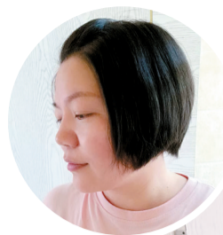
■芳姐已经开始第三次蓄发。

第二次捐发时,儿子已经治愈出院,还上学了,生活的大落大起给了芳姐勇气和信心,她更希望把这份幸运和坚持通过自己的头发传递出去。“每次捐发,我都会发在朋友圈,让更多人了解这件事情,鼓励大家都能参与。”芳姐说,很多朋友也因此成为“捐发天使”,这让他们感受到助人助己的温暖与快乐。现在,芳姐已经开始了第三次蓄发,她说,只要符合要求,她想做一辈子的“捐发天使”。