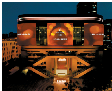
■历史与艺术交织的京杭大运河旁,人头马X.O新篇章在此奏响。

与原先的经典包装相比,人头马X.O焕新包装在保留标志性元素的基础上,多处细节均有升级,人头马X.O作为品牌的标志和人头马酒庄的荣耀之作,在新包装上得到进一步彰显。