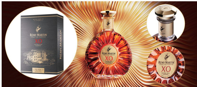
■人头马X.O焕新包装在保留标志性元素的基础上,多处细节均有升级。

优质香槟区干邑专家 Rémy Martin 人头马,日前于杭州运河文化发布中心,全球首发人头马X.O 优质香槟区干邑(Rémy Martin XO Cognac Fine Champagne)全新包装,通过视觉的升级,将人头马近三个世纪的传承匠心一一呈现,也通过更加聚焦的瓶身酒标,让消费者能够一同品味非凡新邑,精彩启程,让久闻的精彩不再久等。