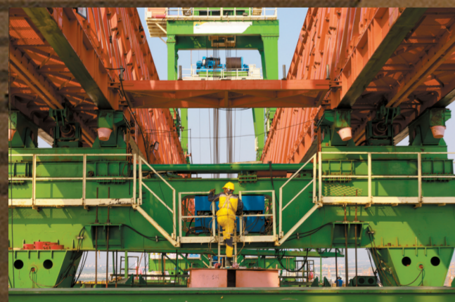
■大桥建设者冒着高温施工。