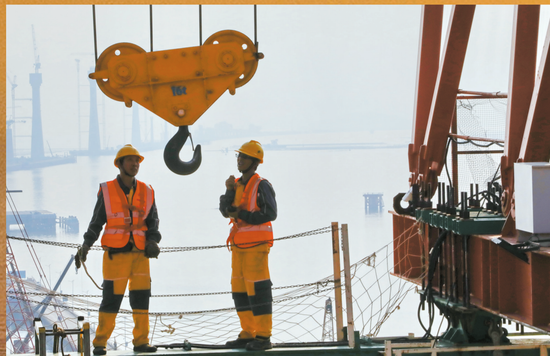
■黄茅海跨海通道施工现场。