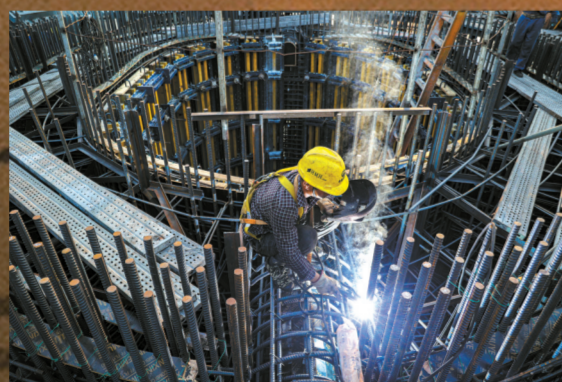
■建设者们精益求精保质量。