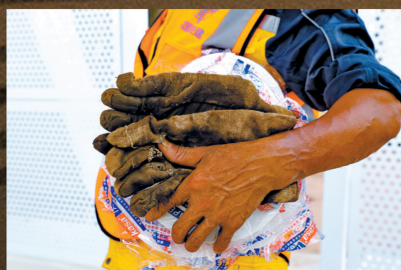
■磨破的旧手套见证了他们的辛苦。

在珠海和江门之间的黄茅海上，一座世界级的跨海通道犹如巨龙卧波，神形初现。这就是正在施工建设的粤港澳大湾区又一超级工程——黄茅海跨海通道。工地上，可见大型设备和钢筋水泥，工人们埋头作业，挥汗如雨，一派热火朝天的景象。