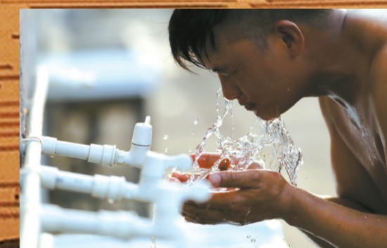
■下班后的建设者享受清凉一刻。