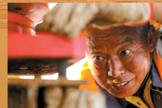
■他们坚守岗位，挥洒汗水。