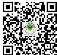
广东公益 恤孤助学促 进会公众号

如“新快报温暖1532号文涛”。如需捐款收据,请在汇款时附注捐款收据回邮地址、联系人姓名及电话。请务必将银行的转账回执传真至新快报(传真:020-85180284),逐日登报明细以传真为准,分批公示以天天公益基金到账为准。