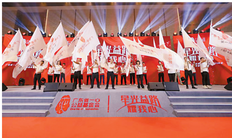
■一心基金会旗手挥舞着旗帜步入会场。