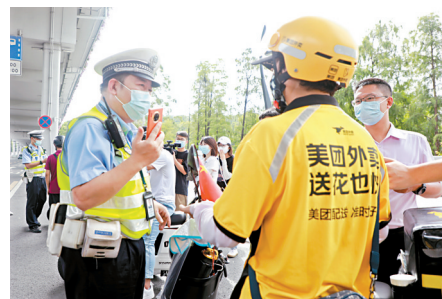
■ 广州交警加强对外卖企业从业人员交通安全守法意识的宣传。