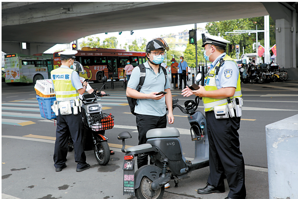
■ 10月2日上午,广州交警部门在大北立交附近依法查处无牌电动自行车上路行驶等交通违法行为。