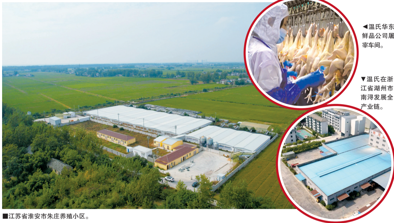
■江苏省淮安市朱庄养殖小区。