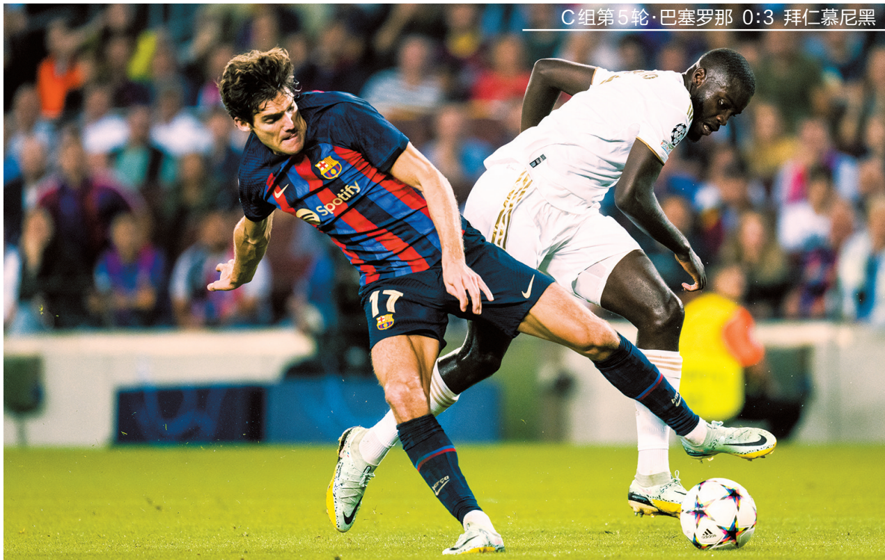
C组第5轮·巴塞罗那 0:3 拜仁慕尼黑