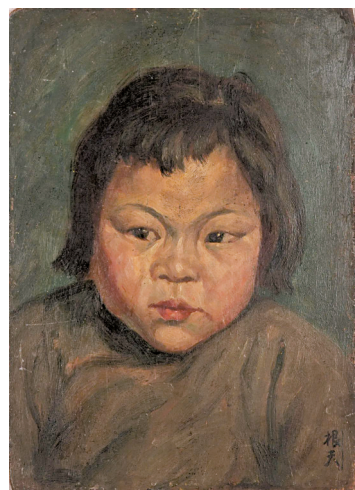
胡根天《小妹》布本油彩 17×21cm

别名胡持秋,号抒秋、志抒,别署天山一叟,广东省开平人,民盟成员。新中国成立之后,担任广州博物馆和广州美术馆第一任馆长,广州市文史研究馆副馆长、馆长,华南文联美术部主任,广东省美术家协会副主席,广东省书法家协会副主席,广州市文联副主席,历任第四届广州市政协常委,第五届、六届广州市政协副主席。