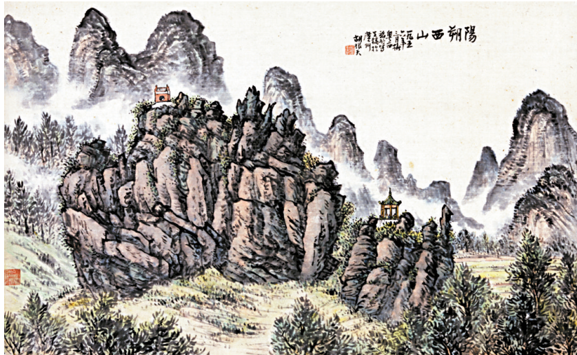
胡根天《阳朔西山》1956年 纸本设色 中国美术馆藏