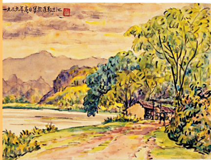
胡根天 连县三江写生,1939年,竹笔画

在胡根天先生诞辰130周年和广州市立美术学校建校100周年之际,日前,广东美术馆特别策划推出“拓荒者——20世纪广东美术进程中的胡根天”艺术展,这是目前为止关于胡根天个案最为完整、最为系统的一次研究呈现。广东美术馆馆长王绍强表示,胡根天先生是广东早期公立美术教育和文博事业的重要开创者和奠基者,他对广东现代美术教育、文博领域的意义,仍然是一个值得我们花力气探讨的课题。