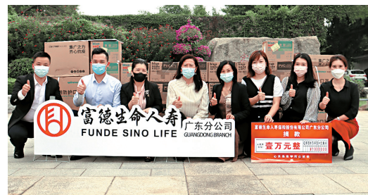
■11月15日,富德生命人寿广州中心支公司向广州海珠区慈善会捐赠1万元防疫物资。

广州市海珠区慈善会相关负责人对富德生命人寿广州中心支公司的支援和捐赠表示感谢,并将秉持物尽其用的原则,统筹协调捐赠物资,将这份爱心和