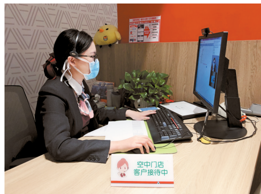
■平安人寿工作人员通过视频线上空中契约调服务。

对保单质押贷款业务,如疫情防控人员或者有特殊需求的客户,经公司审核后,可予以酌情减免疫情