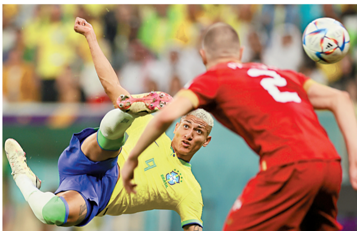
■第73分钟,理查利森侧身倒挂金钩破门,想象力十足,力与美极致展露。

毫无疑问,理查利森的倒挂金钩已成为本届世界杯“最佳进球”的强有力候选。当时皮球来的时候,理查利森先是做了一个触球动作,紧接着身体自然完成转向,顺势勾射打入死角。