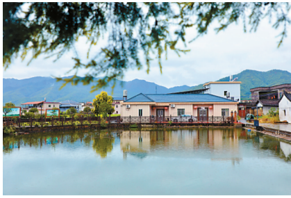
■梅州市平远县东石镇风景如画,工作队计划将景点串联起来打造旅游线路,发展农文旅。