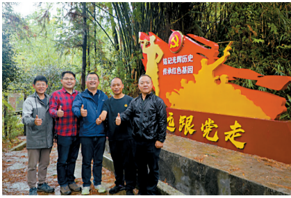
■广州驻梅州市平远县东石镇工作队。