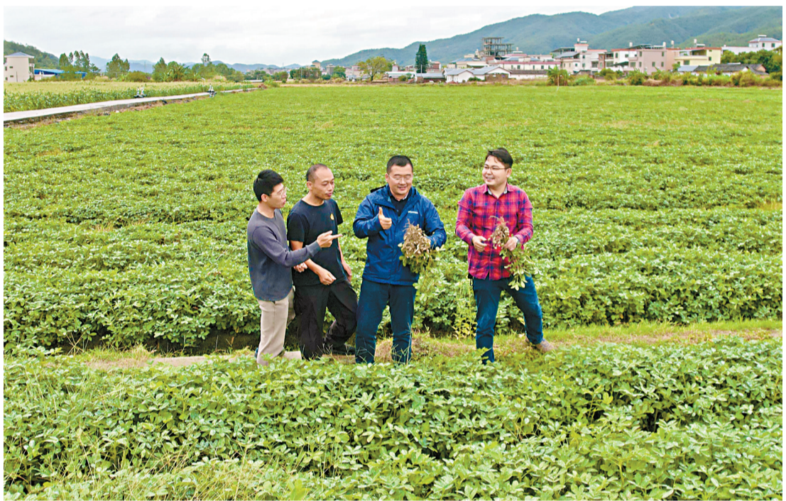
■位于东石镇双石村的高标准农田采用机械化种植的东石花生,长势良好的花生令工作队信心满满。

面对“不愁卖”的东石花生，由广汽集团牵头，广州市文化广电旅游局、广州市体育局、广州市统计局和广汽本田组成的驻东石镇工作队没有止步不前，在东石镇党委和政府、后方单位的支持下，他们紧扣东石镇“一产一带、一心两翼”发展格局，用规模化、标准化、品牌化的长远思维和三产融合的长远目标重新审视这个传统特色产业，从顶层设计到产业布局，从聚合资源到品牌打造，推动“老字号”焕发新活力，与此同时，大力完善东石基础设施，修缮挖掘历史文化资源，为推动东石镇农文旅三产融合发展、实现乡村振兴践行初心使命。