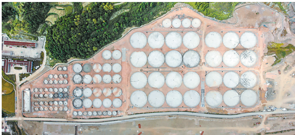
■台江县鲟鳇鱼三产融合产业园全景。