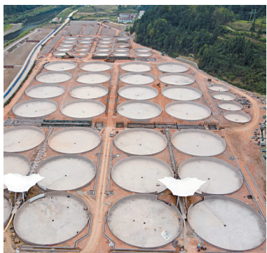
■台江县鲟鳇鱼三产融合产业园。

乡村振兴离不开产业发展，产业发展又离不开资金支持。为支持贵州省台江县振兴发展，通过“广东扶贫济困日”活动，2021年起，广东省国强公益基金会通过广东省乡村发展基金会（原广东省扶贫基金会）累计捐赠3000万元，用于帮助台江县建设鲟鳇鱼三产融合产业园，目前该笔资金分期拨付已全部到位。据了解，鲟鳇鱼三产融合产业园总占地220亩，建成后将成为台江县的支柱型产业，预计年销售收入达到5000万元，可通过为当地增加税收、带动就业、联农带动等一系列方式，助推台江县产业经济更上一层楼。